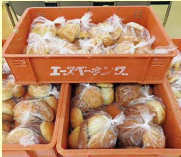
株式会社エスピーキング様