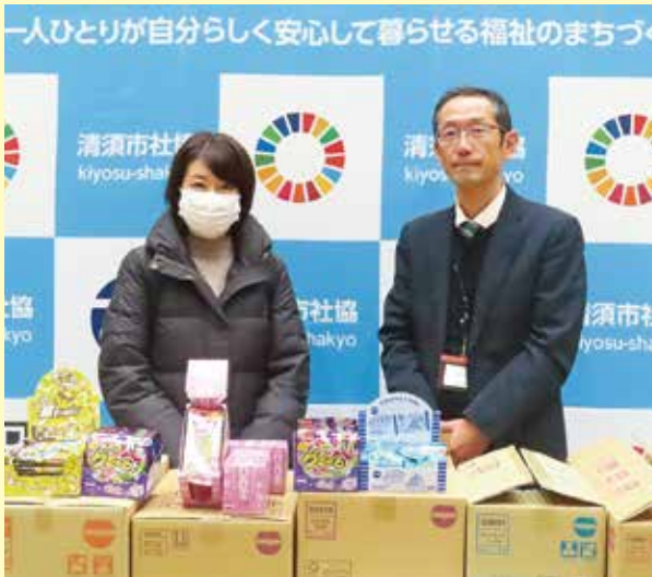
明治チューインガム株式会社様