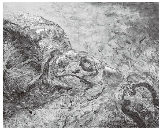
▲「The thread of Life」油彩 727×910mm