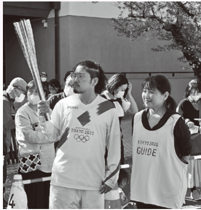
▲東京オリンピックでは聖火ランナーに。

絵を描くことは、本人にとつて存在証明だと思えます。やりがいでもあり、唯自分の自由になるもので、失敗から新しいものが生まれたりもします。制作活動を職業にできて本当に良かったと思います。絵を通して社会とつながれていることがありがたいですね。